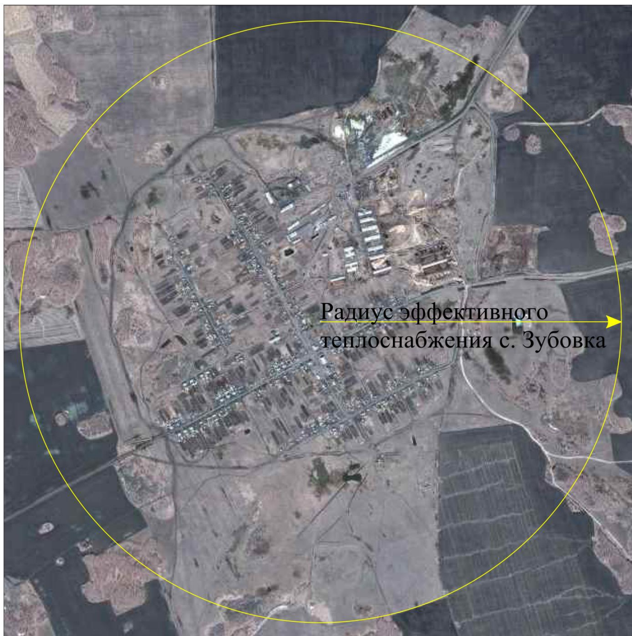
Рисунок 2.1 – Радиус эффективного теплоснабжения с. Zubовка

На основании полученных данных можно сделать вывод, что существующая жилая и социально-административная застройка с. Zubовка полностью находится в пределах радиуса эффективного теплоснабжения, и подключение новых потребителей в границах сложившейся застройки экономически оправдано.